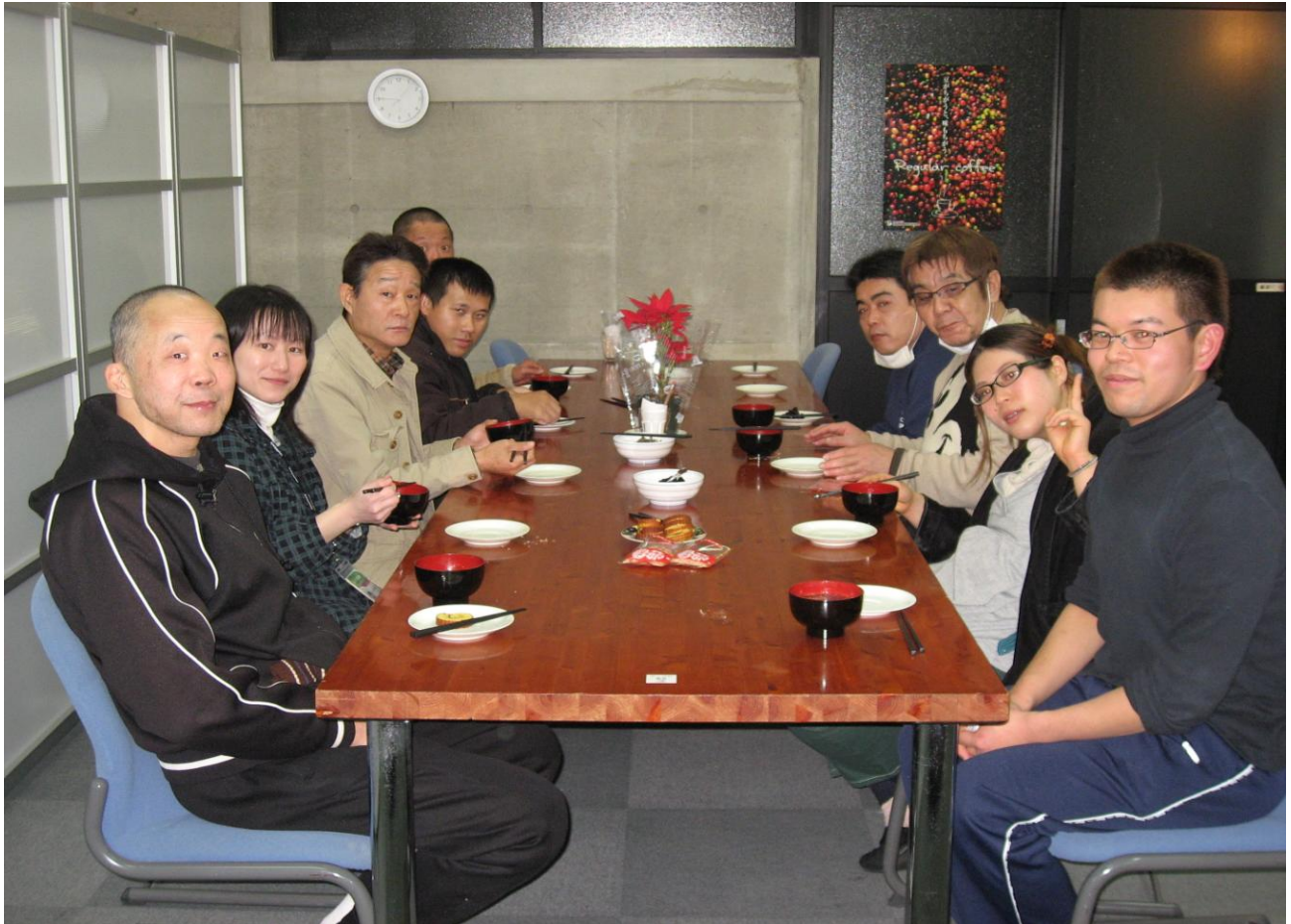
2010年1月6日(水) 新年会

WANATHが開設して3年目に突入しました。様々な紆余曲折あり、WANATHも成長しています。新しいメンバーも入り、昔からのメンバーとともに活動に積極的に取り組んでおります。