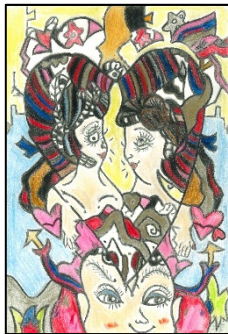
銀賞 『心&言葉』 中島千津代(宮崎県宮崎市)

応募期間 2026.4.1～10.31(詳細はリーフレット参照) たくさんのご応募お待ちしております。