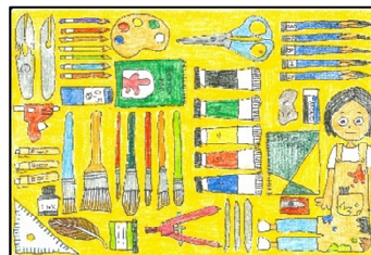
銅賞 『画材』 村松玲奈(愛知県豊橋市)